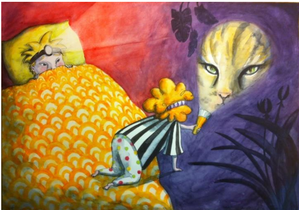
Illustration: Johanna Rehn